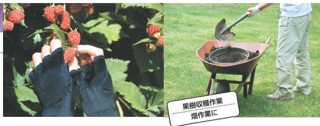
果樹収穫作業 畑作業に